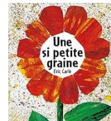
« Une si petite graine » Eric Carle