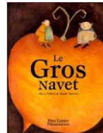
« Le gros navet » Franquin Gérard